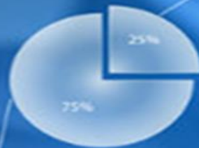
Share of market activity

Changes in the activity of the active and passive market is uncertain. Established positive trends in various market segments.