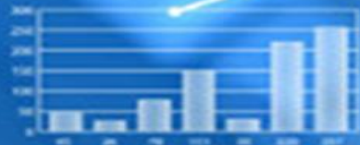
Projected sales of main products in 2013

Changes in the activity of the active and passive market is uncertain. Established positive trends in various market segments.