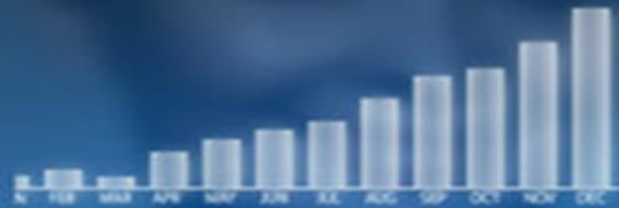
Projected sales of main products in 2013